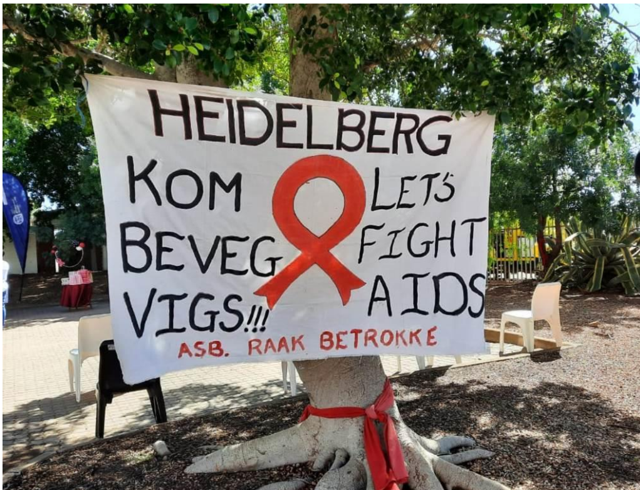
Die CHW's van Slangrivier het hul bewusmaking by die kliniek gedoen en talle moeders en kinders bereik.